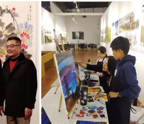
大好河山美如画 纪念中美建交39周年著名艺术家书画作品展