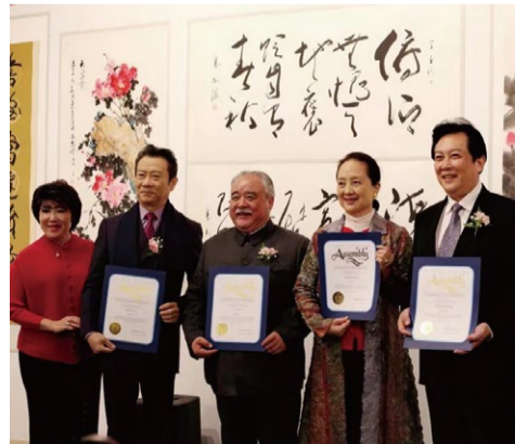
纪念中美建交39周年著名艺术家书画作品展