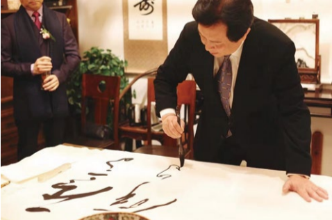
中国著名表演艺术家、中国视协艺术家书画协会会长唐国强题字