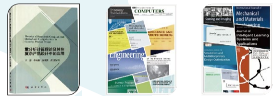
开发团队核心成员曾发表高水平科研论文200余篇

在上海，为马云打造一家酒吧 在阿里巴巴20周年时，由直觉泵为阿里设计研发的“阿里创意投影酒盒”在网络的热议中意外走红，这款拥有“高颜值”的创意投影酒盒，让直觉泵与马云的合作从一瓶酒延伸至一家酒吧。