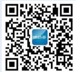
扫一扫，关注微信公众号