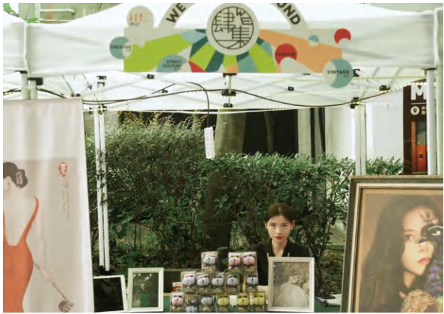
市集现场@扉灵社私人定制Studio