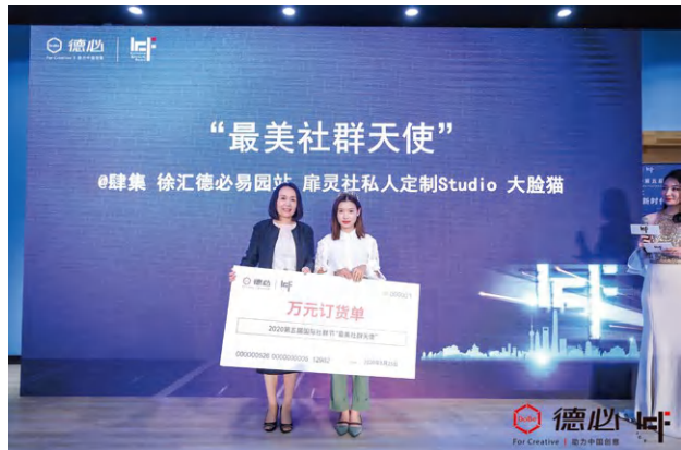
最美社群天使加冕现场