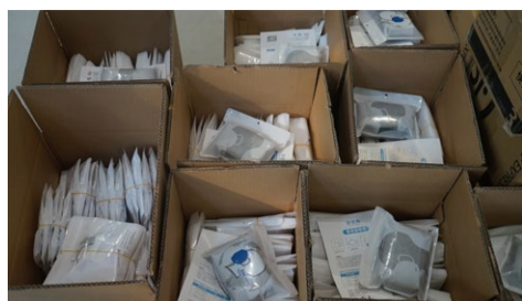
“亏本跨界”做口罩 和创服饰 @德必川报易园

“Beautiful life is with you!”疫情当前，一箱箱寄托着美好祝愿的口罩，正从天府成都发往全国各地。