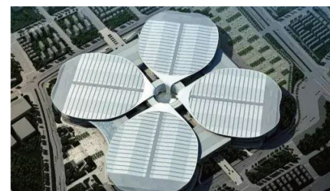
硬核企业让呼吸更安全 风神集团 @昭化德必易园

随着多数企业陆续复工复产，大家的生活、工作节奏也将逐步恢复常态。那么，在园区、商务办公楼宇或是商场等公共空间，怎样的空调系统才能有效的阻隔病毒传播？