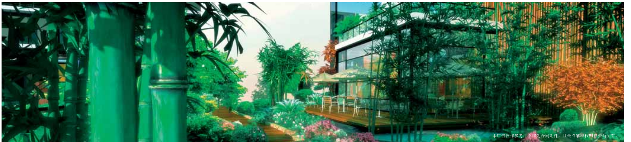
本广告仅作参考，不作为合同附件，且最终解释权归投资方所有。