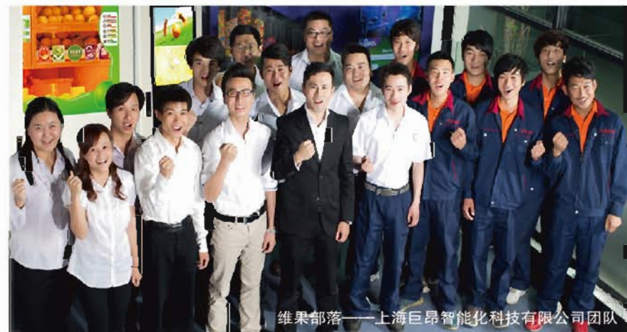
维果部落——上海巨昂智能化科技有限公司团队

Name: 上海巨昂智能化科技有限公司 Add: 上海市虹口区哈尔滨路160号老洋行1913创意园区A幢312室 Tel: 021-63250189