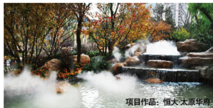
项目作品：恒大太原华府

“该行业未来或将有两个发展方向，即通过行业间企业的收购兼并树立业内巨无霸的地位，另一个则是借助明星设计师做精品项目，我们希望能两者兼而有之。”