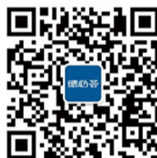
扫一扫, 关注微信公众账号

作为专业的创意园区媒体网络, 德必园区数码海报屏能够精准接触客户群体, 覆盖最具价值的消费人群。同时, 德必超强的媒体管理系统, 超强的专业服务团队更是企业宣传的坚实保障。现诚挚为有广告需求的园区企业提供专业服务。 详情请洽: 4006-525-777